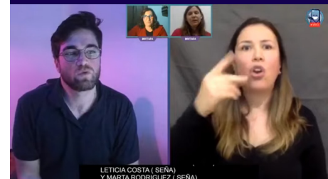
DILS - PRIMER SISTEMA INTEGRAL DE ACCESIBILIDAD VIRTUAL EN VIVO

Como fundador de DiLS, estoy orgulloso de haber liderado el desarrollo de una aplicación de servicio de intérprete en línea que funcionaba perfectamente y accesible para todas las personas. Los sordos la utilizaron mucho, en total más de +800 horas por 3 años. Mi experiencia como CEO me permitió desarrollar mis habilidades en liderazgo y estrategia empresarial.