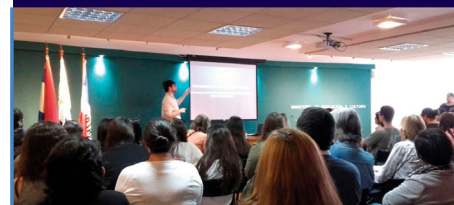
CULTURAL POR EL MEC

El objetivo de este video es ser tomado en cuenta y hacer que la gente reflexione sobre la importancia de incluir a todos en la sociedad, independientemente de sus habilidades o limitaciones. Espero que este video sensibilice a la gente sobre la importancia de la accesibilidad y ayude a crear una sociedad más inclusiva para todos.”