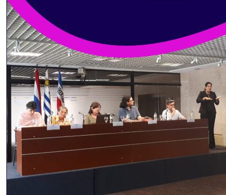
EN EL PALACIO LEGISLATIVO

Como representante de la Sociedad civil, participé en el encuentro de trabajo "Derecho a la Accesibilidad" donde expuse sobre la importancia de la accesibilidad, los ajustes razonables y los apoyos. También brindé una conferencia sobre los aspectos de la accesibilidad y cómo aplicarlos en diferentes ámbitos de la sociedad. Mi objetivo es garantizar una sociedad inclusiva y accesible para todas las personas.