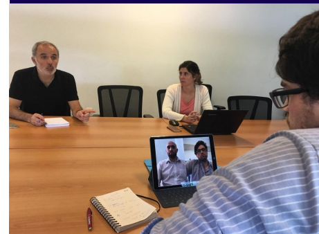
REUNIÓN CON DILS EN ANII

En esta posición, fui el CEO de una aplicación de servicio de intérprete en línea. Tuve la responsabilidad de liderar el equipo de desarrollo, establecer estrategias de negocios y expandir la presencia de la aplicación en el mercado. Este trabajo me permitió desarrollar mis habilidades en liderazgo y estrategia de negocios. Además, gané el premio de ANII y recibí un subsidio. www.appdils.com