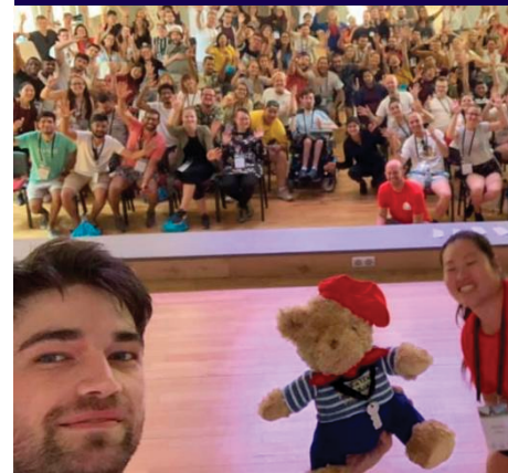
WFIDS - PARIS, FRANCIA

Como representante de la Sociedad civil, participé en el encuentro de trabajo "Derecho a la Accesibilidad" donde expuse sobre la importancia de la accesibilidad, los ajustes razonables y los apoyos. También brindé una conferencia sobre los aspectos de la accesibilidad y cómo aplicarlos en diferentes ámbitos de la sociedad. Mi objetivo es garantizar una sociedad inclusiva y accesible para todas las personas.