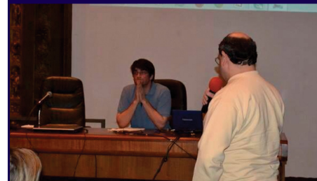
INTENDENCIA DE MONTEVIDEO

El avance de las tecnologías ha tenido un impacto positivo en muchas áreas de la vida, y estoy emocionado de formar parte de esta tendencia y contribuir a mejorar la calidad de vida de las personas a través de soluciones tecnológicas inclusivas.”